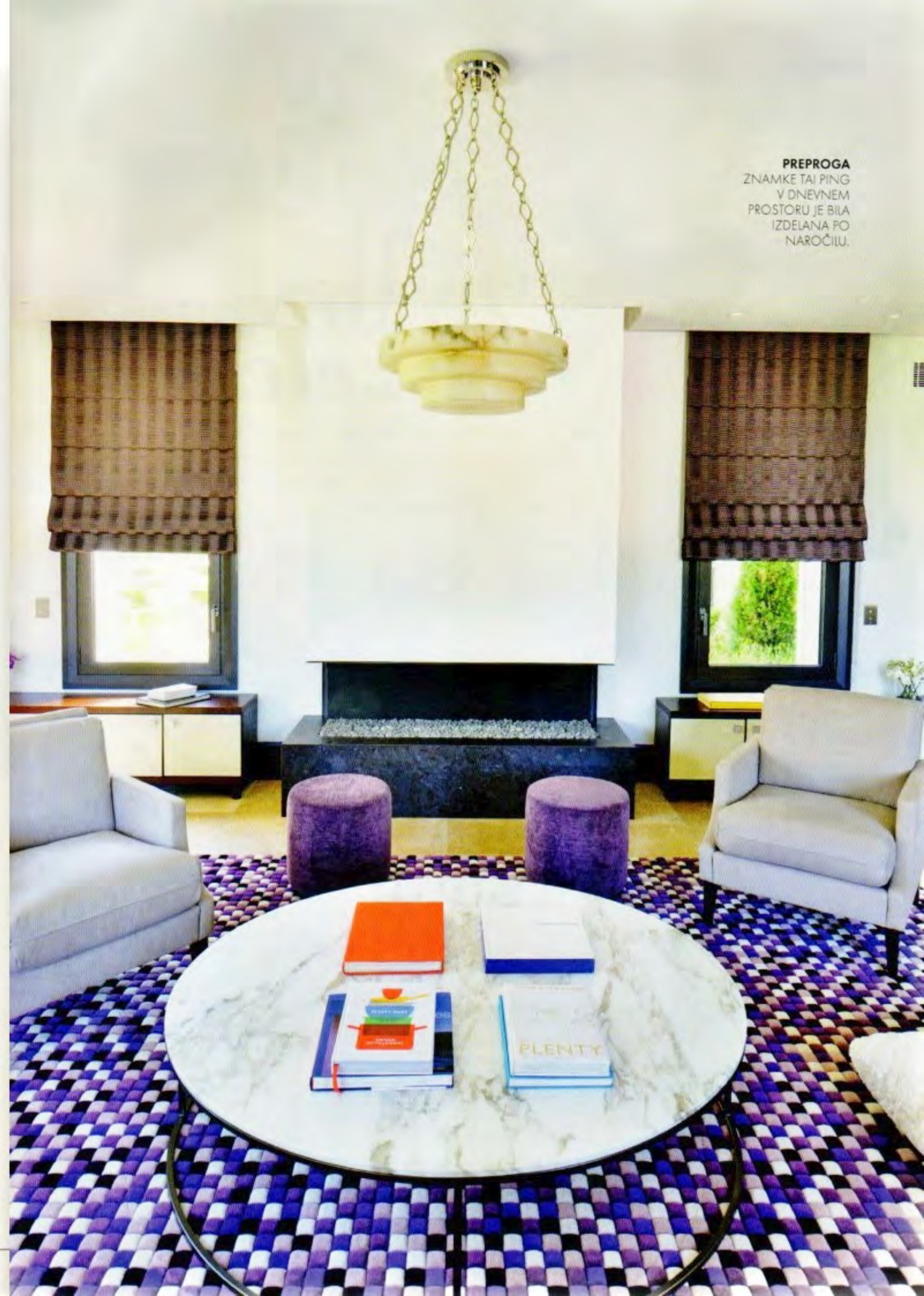
PREPROGA ZNAMKE TAI PING V DNEVNEM PROSTORU JE BILA IZDELANA PO NAROČILU.

Kontrast temno sive in slonokoščene barve se nadaljuje v kuhinji in dnevnem prostoru, kjer monotonost prekinajo vijoličaste blazine in preproga z geometričnim vzorcem v vijoličastih odtenkih in beli. Središče kuhinje je velik kuhinjski otok s pomivalnim koritom, ki se nadaljuje v majhno in preprosto mizo z opečnatimi stoli ter delovni površini doda novo namembnost. Gladek in bled kamen, ki prekriva celotno pritličje, neprekinjeno vodi na teraso z bazenom, tokrat s sivim in modrim mozaikom, manjšim barom in udobnimi sedeži, kot nalašč za druženje in zabavanje gostov. V prvem nadstropju kamen zamenja les iz temnega lesa, v spalnici pa mehka preproga. Tu se ponovijo temno rjavi in slonokoščeni odtenki, prostor pa poživijo zrcalni detajli. Balkonska vrata odpirajo pogled na teraso z zunanjim tušem in prekrasen razgled na pokrajino, ki še zlasti zablesti ob sončnem zahodu nad mestom Grasse. Prostorna kopalnica je opremljena v skladu z modelom luksuznih hotelov, ki ga ustvarjajo kamnita tla in marmornati detajli. Najzanimivejši element kopalnice je zagotovo prostostoječa kopalna kad, ki pričara vtis velnesa. ←