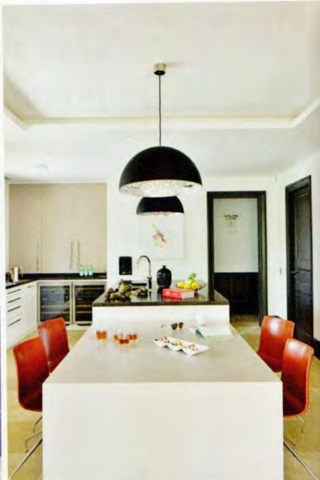
SODOBNA KUHINJA S STOLI ARPER IN VISEČIMI SVETILKAMI ZNAMKE CATALANI SMITH.