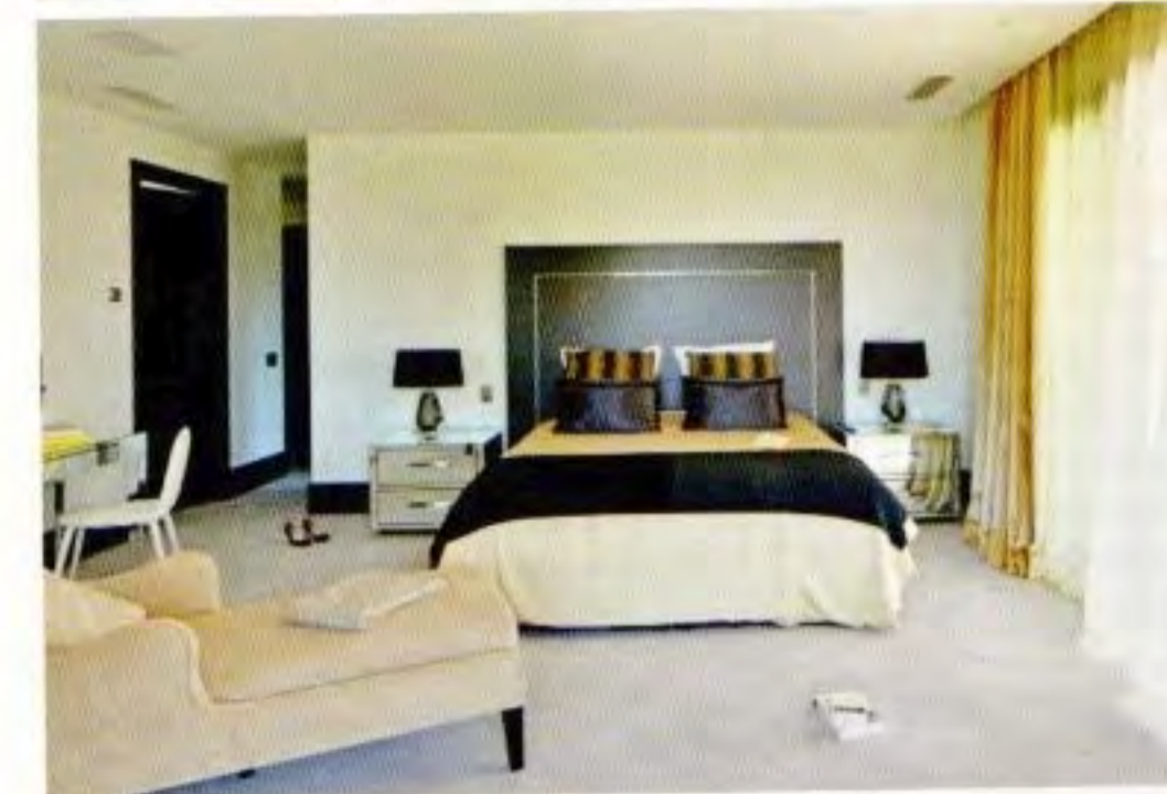
SPALNICO BOGATIJO MIZA Z ZRCALOM, NOČNI OMARICI IN POČIVALNIK.

Kontrast temno sive in slonokoščene barve se nadaljuje v kuhinji in dnevnem prostoru, kjer monotonost prekinajo vijoličaste blazine in preproga z geometričnim vzorcem v vijoličastih odtenkih in beli. Središče kuhinje je velik kuhinjski otok s pomivalnim koritom, ki se nadaljuje v majhno in preprosto mizo z opečnatimi stoli ter delovni površini doda novo namembnost. Gladek in bled kamen, ki prekriva celotno pritličje, neprekinjeno vodi na teraso z bazenom, tokrat s sivim in modrim mozaikom, manjšim barom in udobnimi sedeži, kot nalašč za druženje in zabavanje gostov. V prvem nadstropju kamen zamenja les iz temnega lesa, v spalnici pa mehka preproga. Tu se ponovijo temno rjavi in slonokoščeni odtenki, prostor pa poživijo zrcalni detajli. Balkonska vrata odpirajo pogled na teraso z zunanjim tušem in prekrasen razgled na pokrajino, ki še zlasti zablesti ob sončnem zahodu nad mestom Grasse. Prostorna kopalnica je opremljena v skladu z modelom luksuznih hotelov, ki ga ustvarjajo kamnita tla in marmornati detajli. Najzanimivejši element kopalnice je zagotovo prostostoječa kopalna kad, ki pričara vtis velnesa. ←