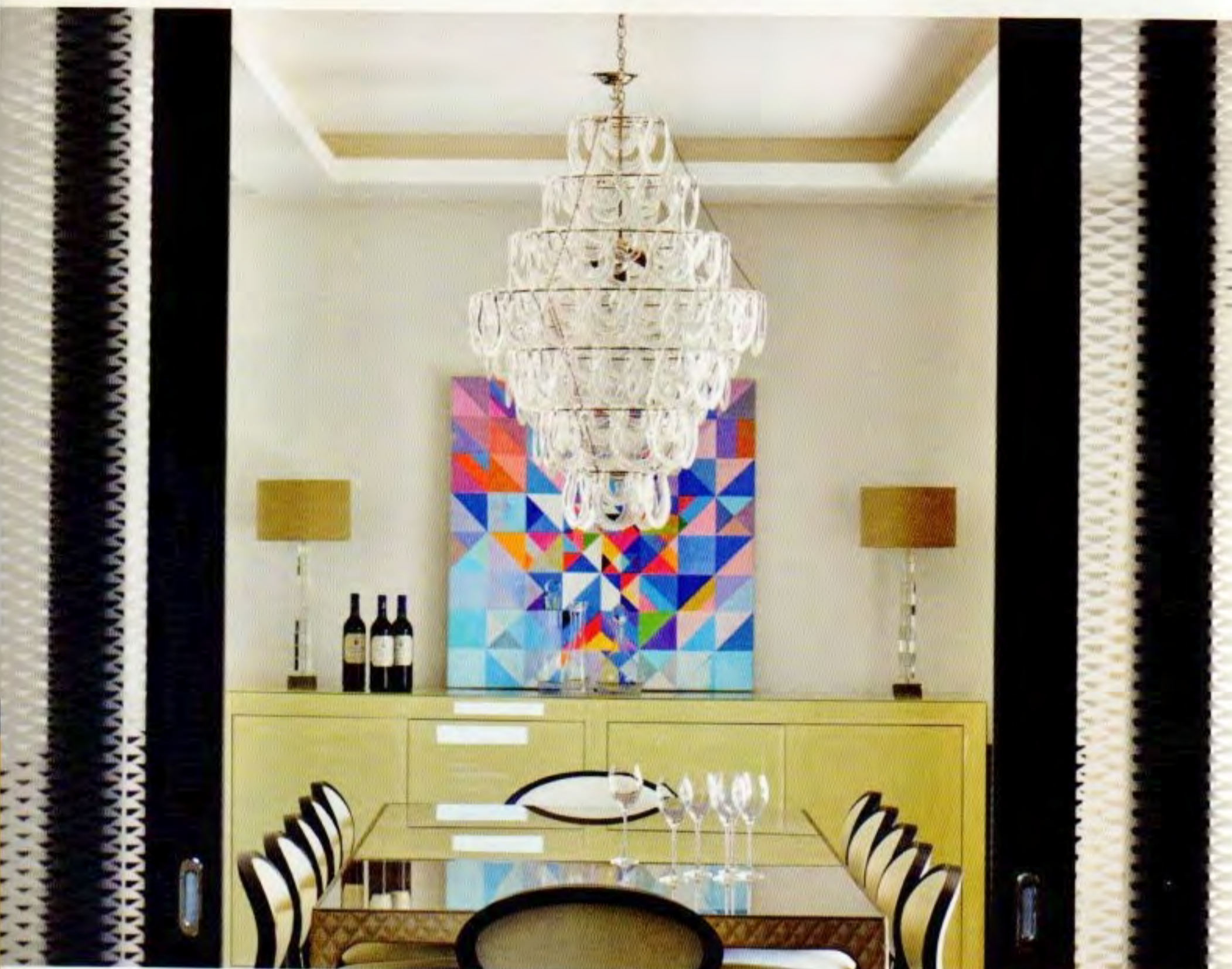
JEDILNICA S STEKLENIM LESTENCEM IN UMETNINO Z GEOMETRIČNIM VZORCEM.