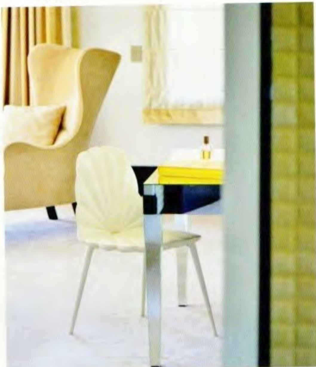
POGLED V SPALNICO.