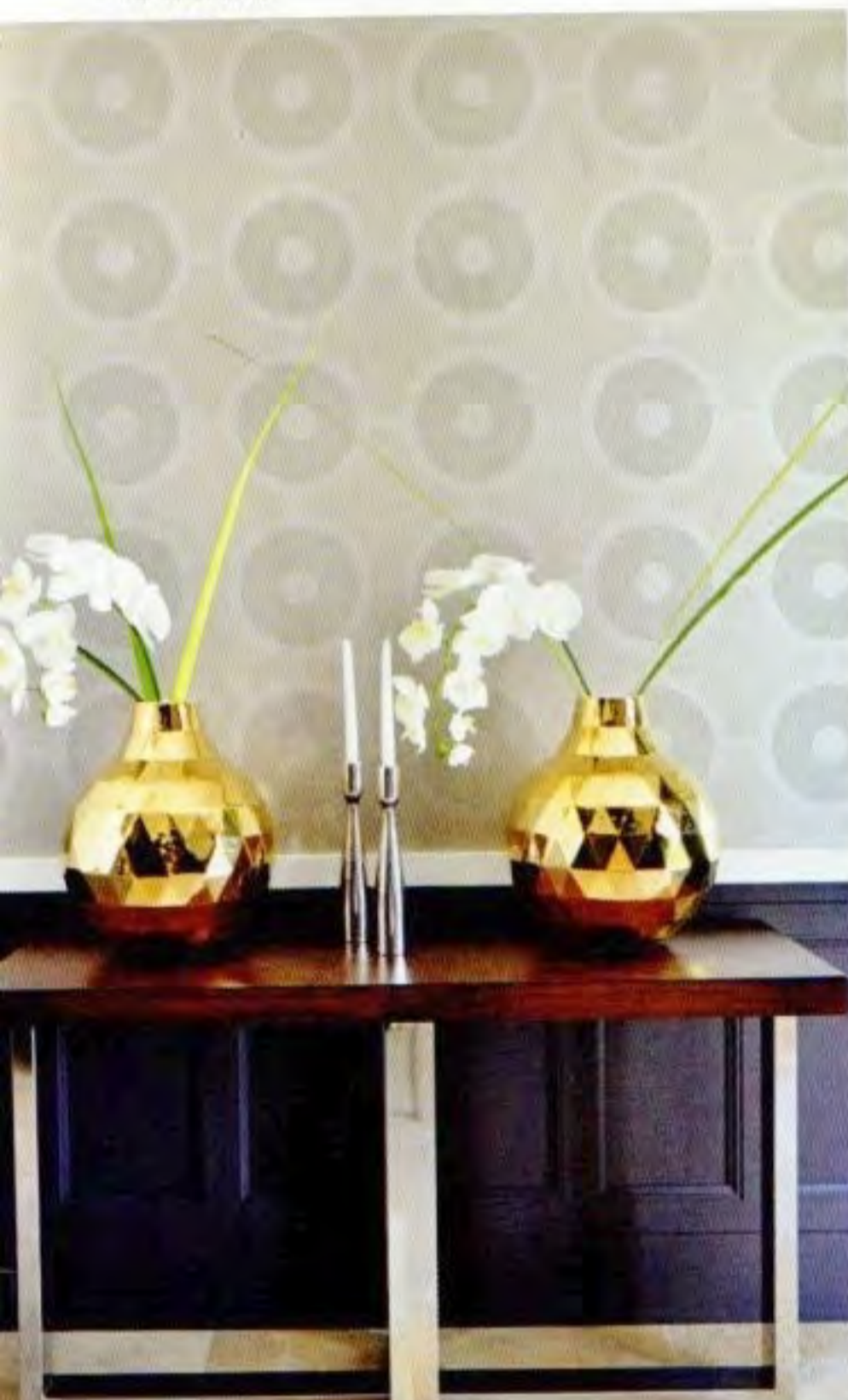
DETAJLI NA HODNIKU.